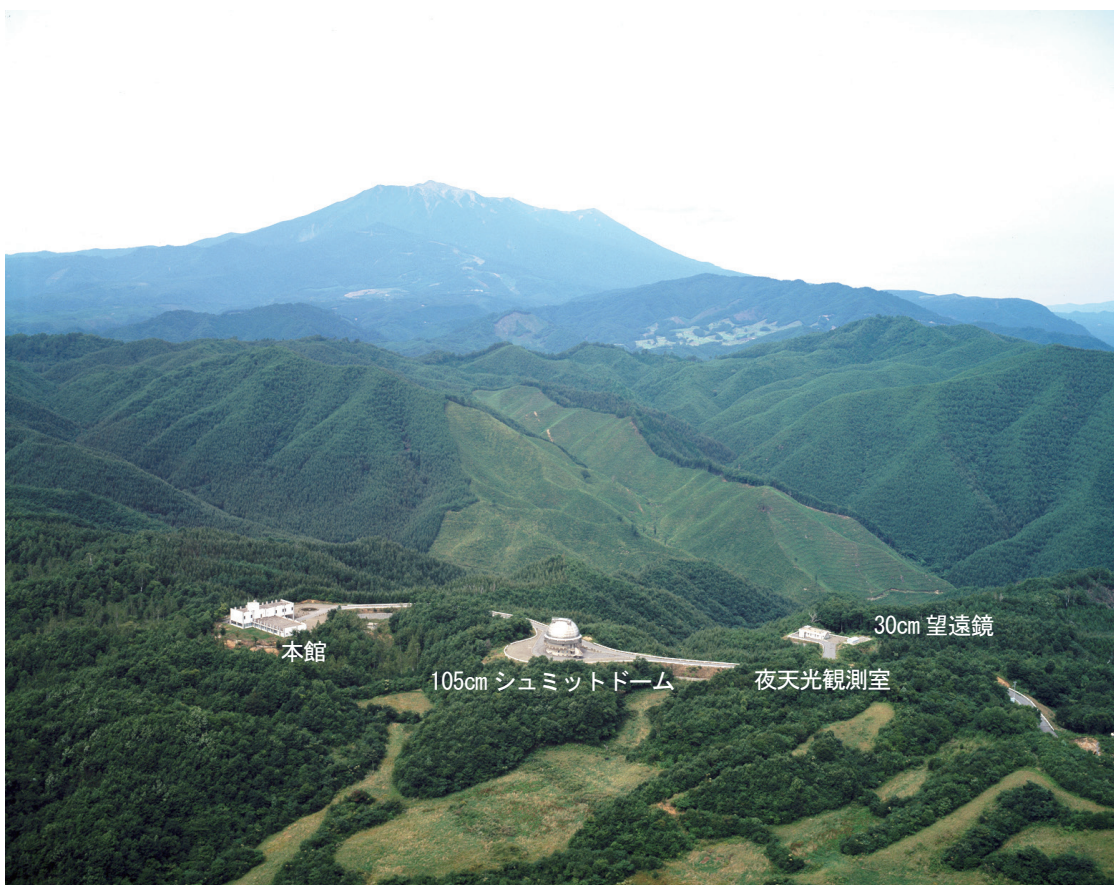
木曽観測所の全景(航空写真)